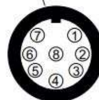
8 pins Binder 712 female connector external view