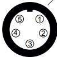
5 pins Binder 712 female connector external view